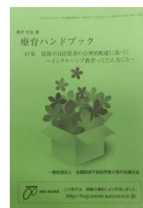
療育ハンドブック