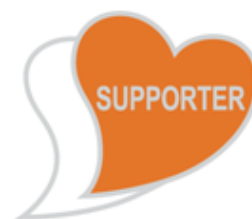
あいサポートバッジ

あいサポーター（障がい者サポーター）は日常的にこのバッジを身につけ気軽に手助けをしやすい環境を作るとともに、共生社会の大切さなどを広めます。